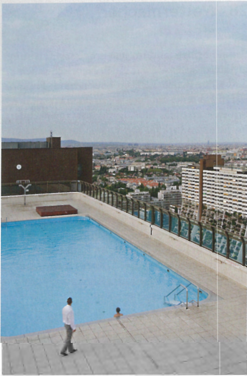
Die Dachschwimmbäder auf den Hochhausdecken von Alt Erlaa sind ein Glücksversprechen für die Bewohner. Die Grosssiedlung aus den 1970er Jahren rangiert auf dem vordersten Platz im Zufriedenheitsranking der Wiener Wohnanlagen. → S. 68