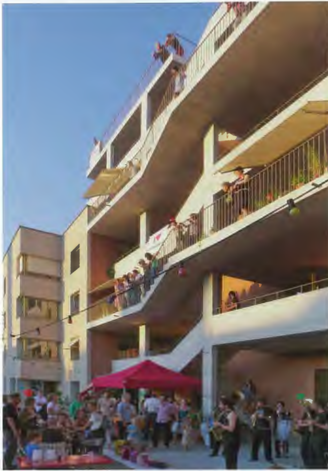
Links: Kraftwerk 1, Siedlung Heizenholz – Einweihungsfest 2012. Rechts: Runder Tisch zum kostengünstigen Wohnungsbau in Meggen – Workshop Sommer 2013.